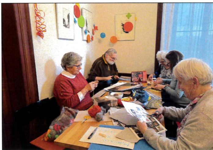
Inspirierender Handarbeitsnachmittag für Mann und Frau.