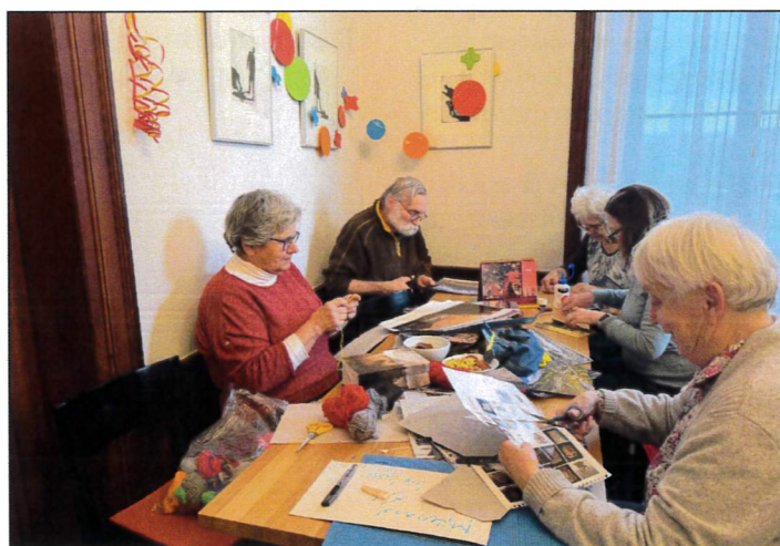
Inspirierender Handarbeitsnachmittag für Mann und Frau.