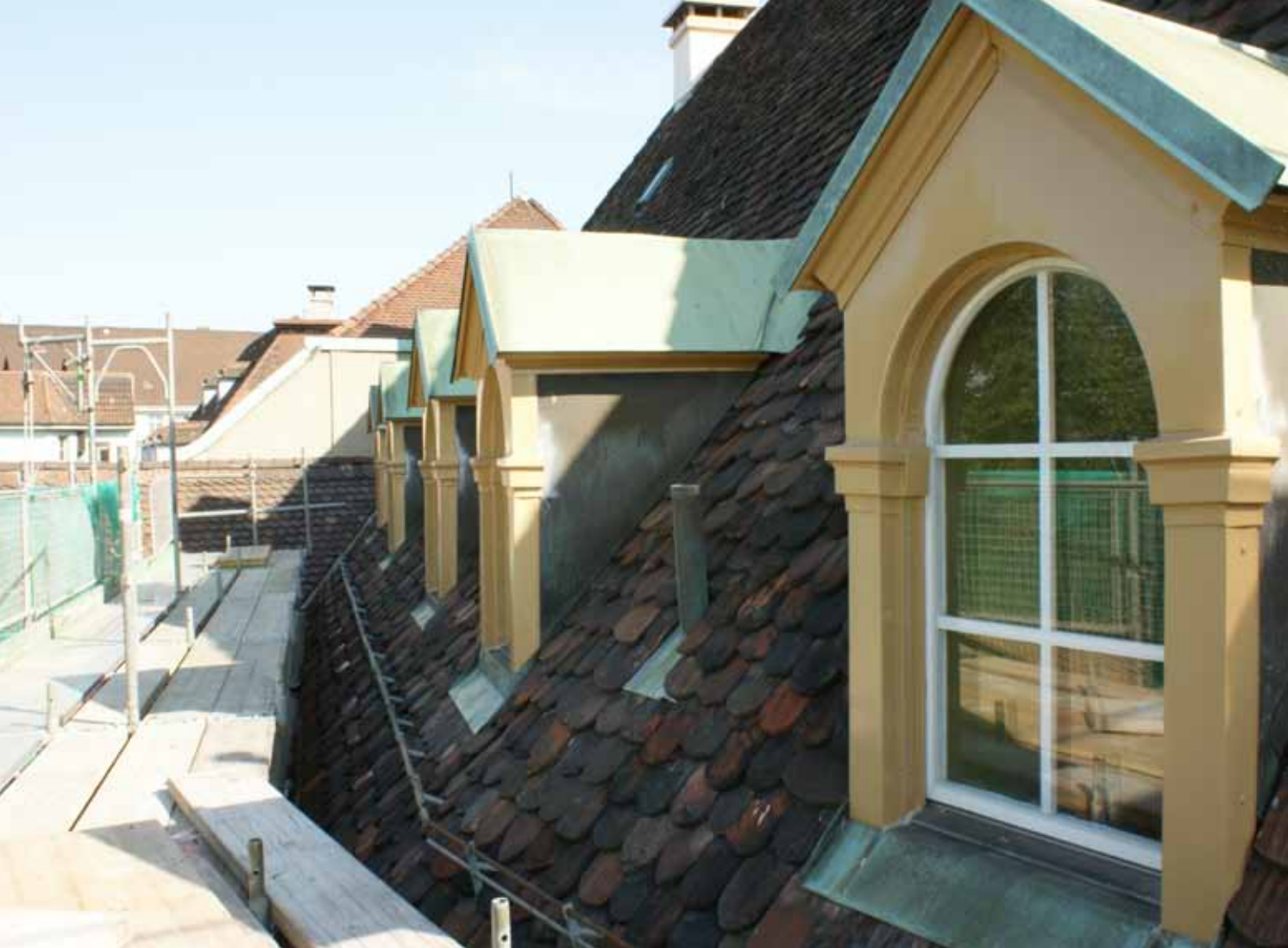
Lukarnen hofseitig in Blechkleid (oben) und auf der Strassenseite in Holz und gemauert.