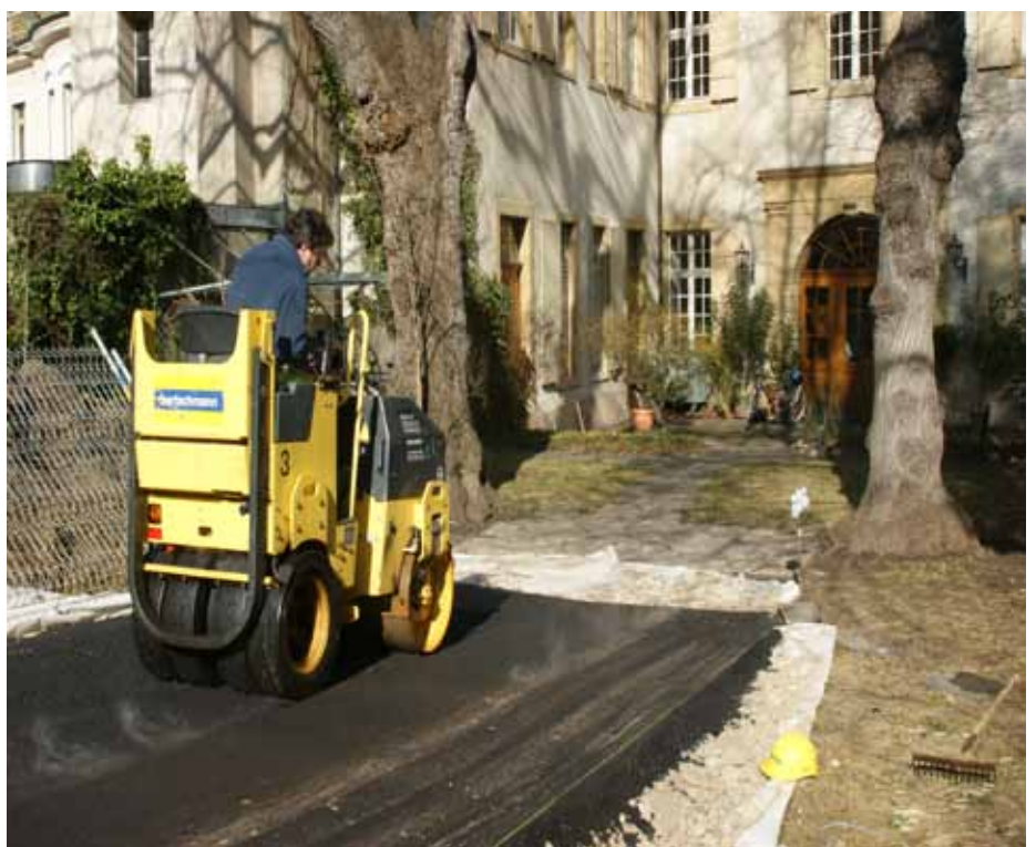
Planieren, asphaltieren, fertig. In zwei Tagen war die Zufahrt erstellt.