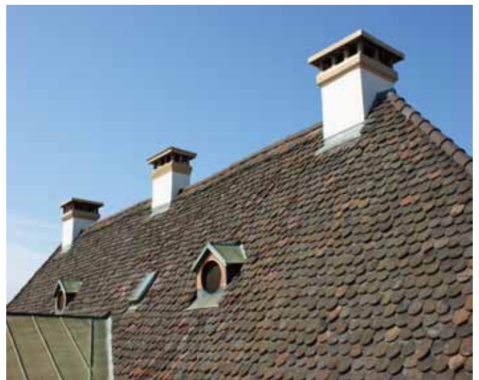
Von oben links: Steinhauerarbeit an den beiden Türen zum Anbau im Hof: Millimetergenau werden die neuen Steine behauen und eingesetzt. - Blick in den Estrich. Die Kaminzüge sind schräg angeordnet, damit die Kamine selbst symmetrisch auf dem Giebel sitzen können. Angeschlossen sind sie allerdings längst nicht mehr. Unten links: Innensicht des Biberschwanz-Doppelziegeldachs.