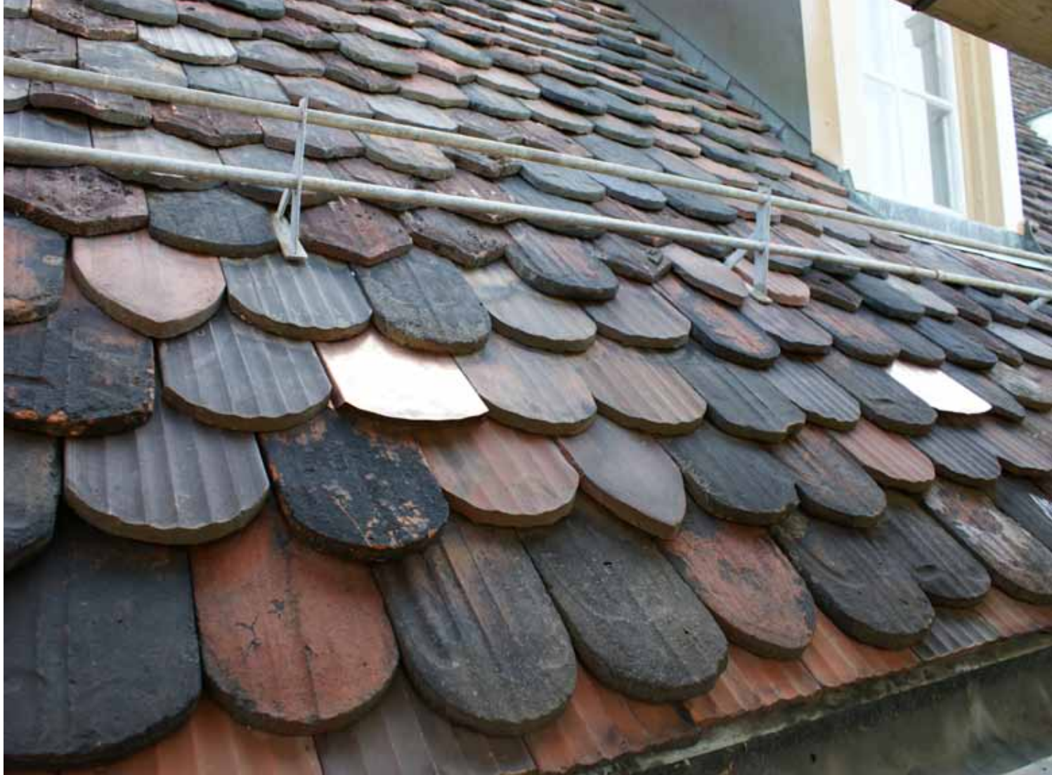
Kupferattrappen zwischen den Ziegeln zur Belüftung (oben), Rundbogenfenster im Giebel.