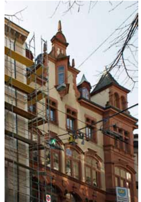
Oben: Noch grüsst die Fahne aus dem 3. Stock. Rechts: Blick auf die Mägd nebenan.

Unten: Gerüstaufbau bei Trambetrieb. Ein „Fussgängertunnel“ vor dem Formonterhof durfte nicht eingerichtet werden. Aus Sicherheitsgründen: Wenn ein Tram just vor dem Haus hätte evakuiert werden müssen, hätten die Passagiere nicht aussteigen können.