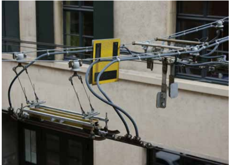
Oben rechts ein Blick auf das „Gehenk“ des Trams.