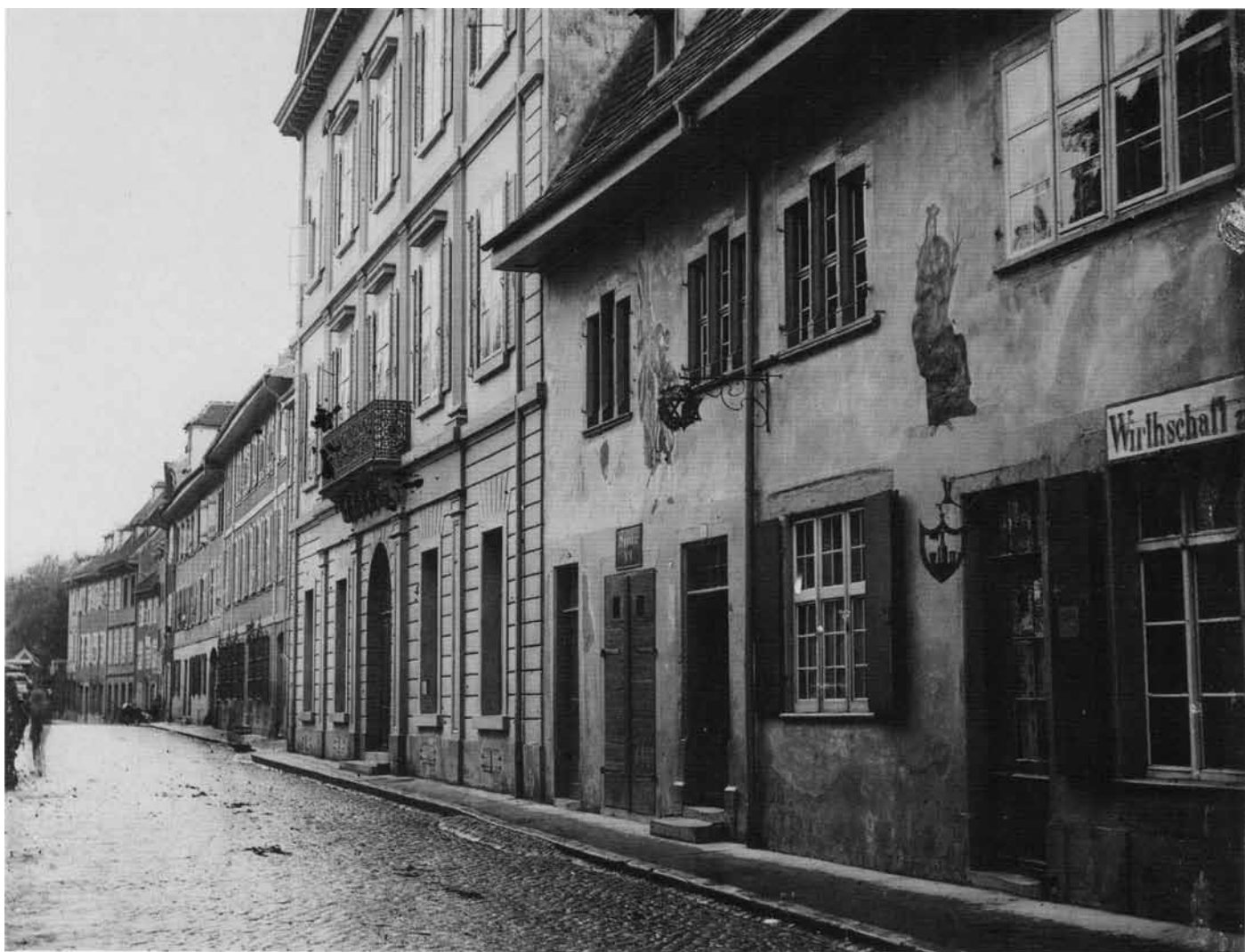
Dies dürfte eine der erste Fotografien des Formonterhofs sein, entstanden zwischen 1864 und 1871. Die Wirtschaft zur Mägd im Vordergrund steht noch auf der gleichen Baulinie; dies ist auch der Grund, weshalb der Formonterhof an der heute vorstehenden nordwestlichen Giebelfassade keine Fenster aufweist.

dort hatte er sich das ausschliessliche Privileg sichern können, Zucker nach Preussen zu liefern, und ebenso wurde er durch die Ernennung zum preussischen Konsul in der bedeutenden französischen Hafenstadt ausgezeichnet. Seine Töchter Ernestine-Elisabeth und Marguerite-Louise wurden von den Partnern des Berliner Bankhauses Schickler, dem aus Basel stammenden Johann Ernst Schickler und dessen Schwager David Berends, zum Altar geführt.