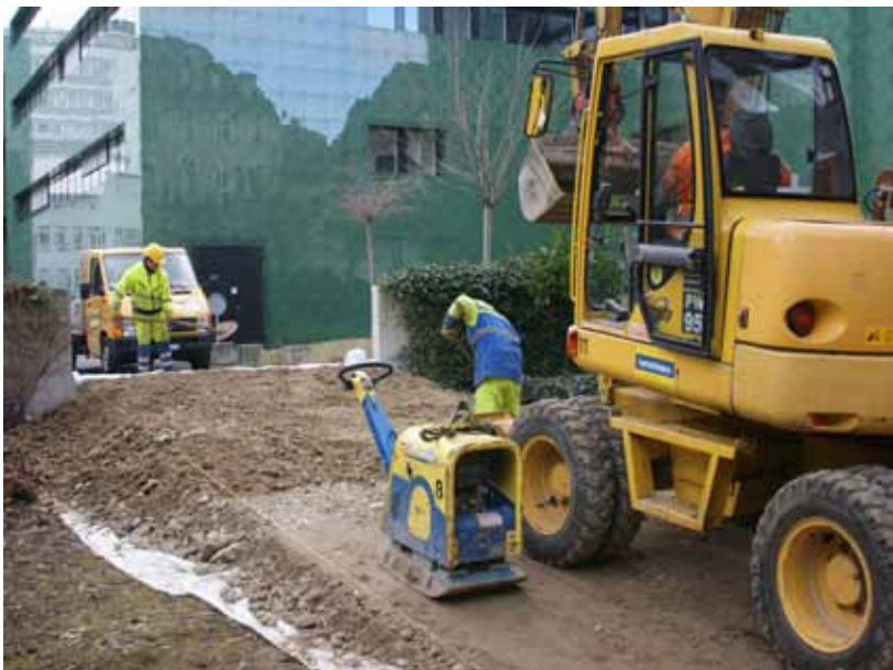
Bild links und rechte Seite oben: Mit dem Loch in der Mauer war es nicht getan: Da der Garten 80 cm tiefer liegt als der Platz vor der Spitalapotheke, musste eine Rampe gebaut werden.

Rechte Seite unten: Hand anlegen - wo ist das Problem?